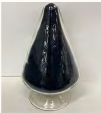
◆ マンガン酸リチウム ◆