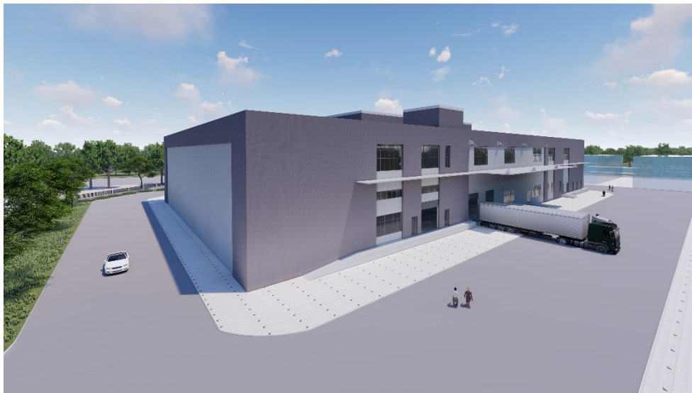
GPF 触媒生産棟完成予想図